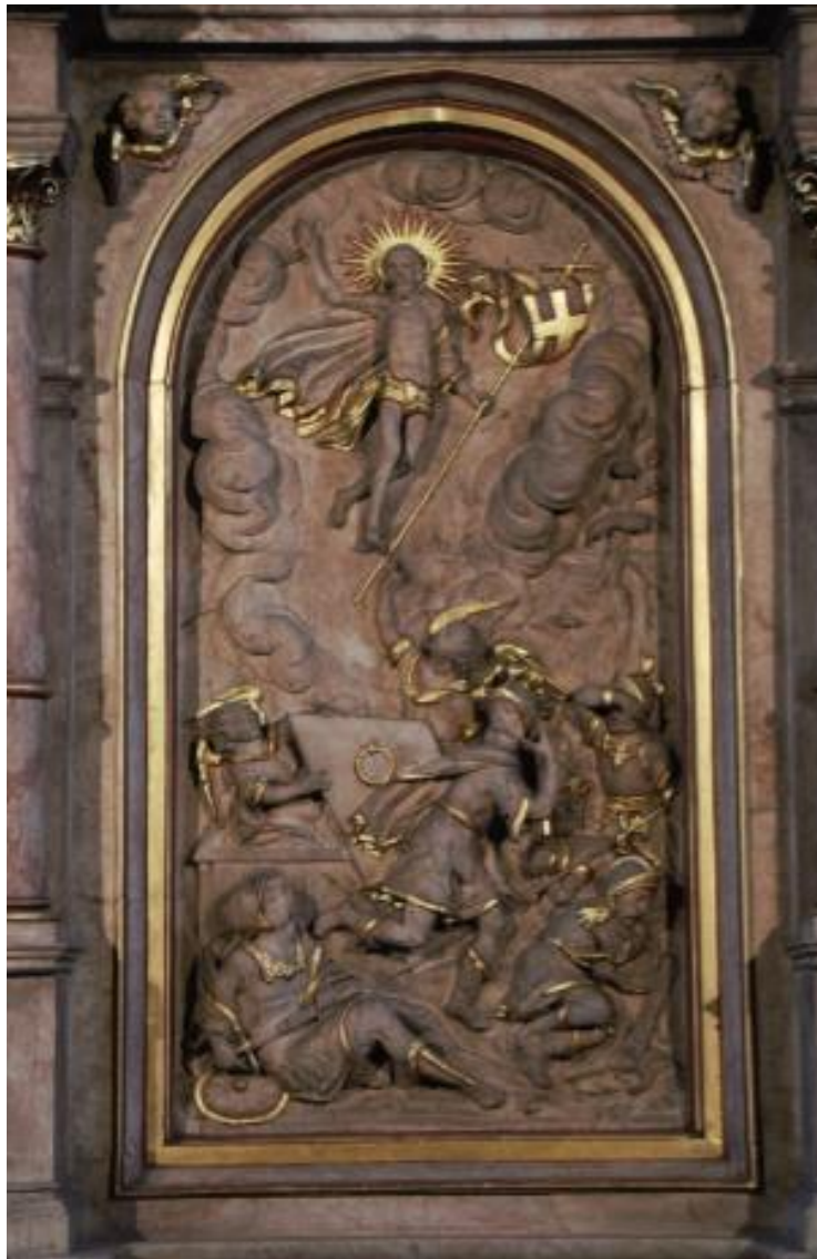
Auferstehungsdarstellung aus dem Hochaltar der Pfarrkirche St. Kilian zu Lichtenau.